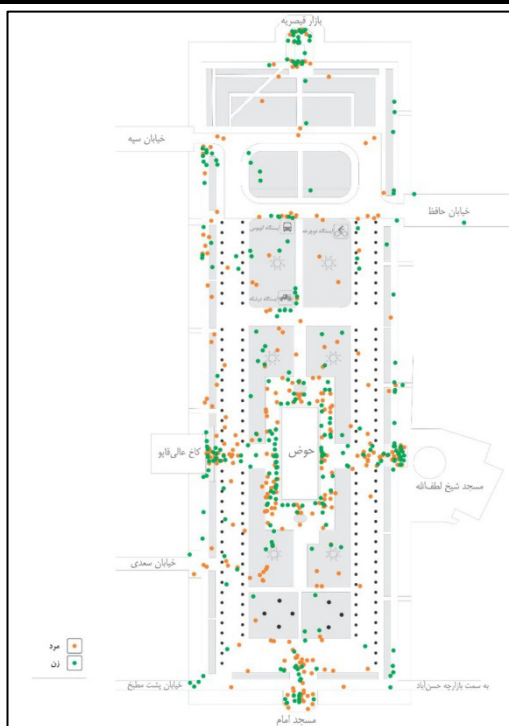
شکل ۳. نقشه نقاط مکث شهروندان بر اساس پرسش‌نامه‌های پر شده