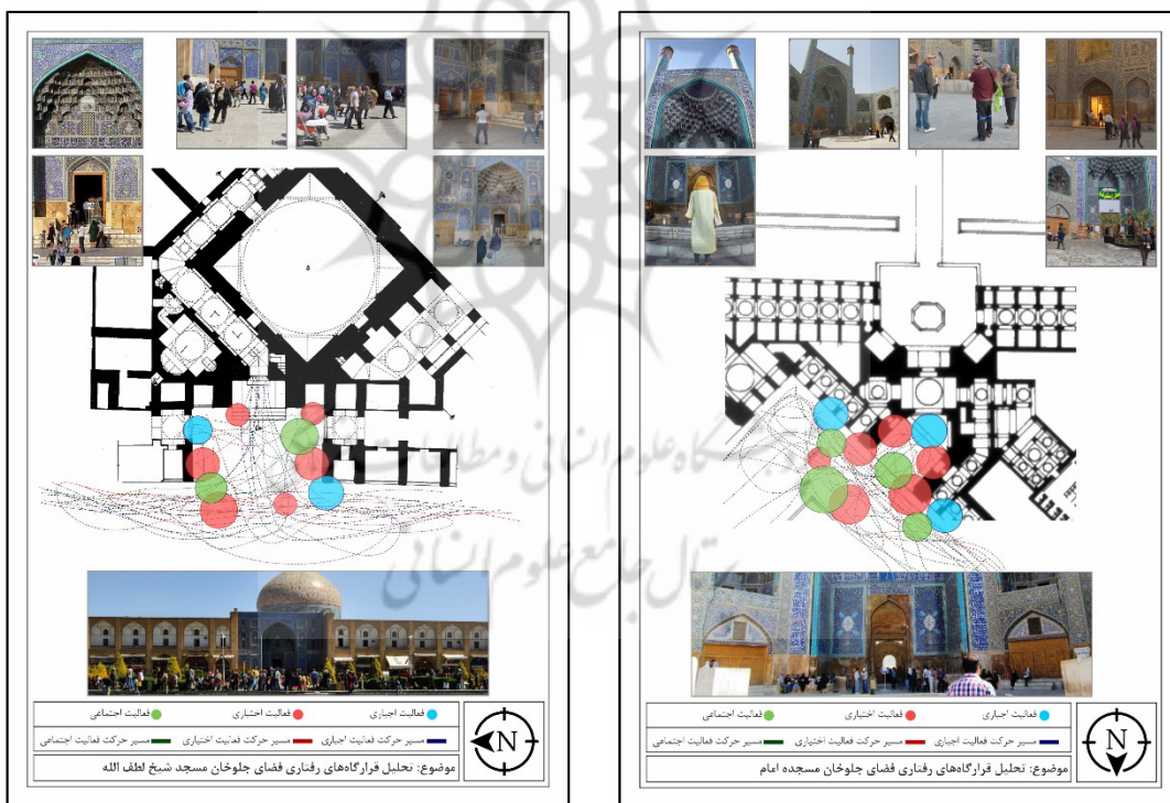
شکل ۵. نقشه قرارگاه رفتاری و مسیرهای حرکتی فضای شهری مجاور بر اساس نظریه گل