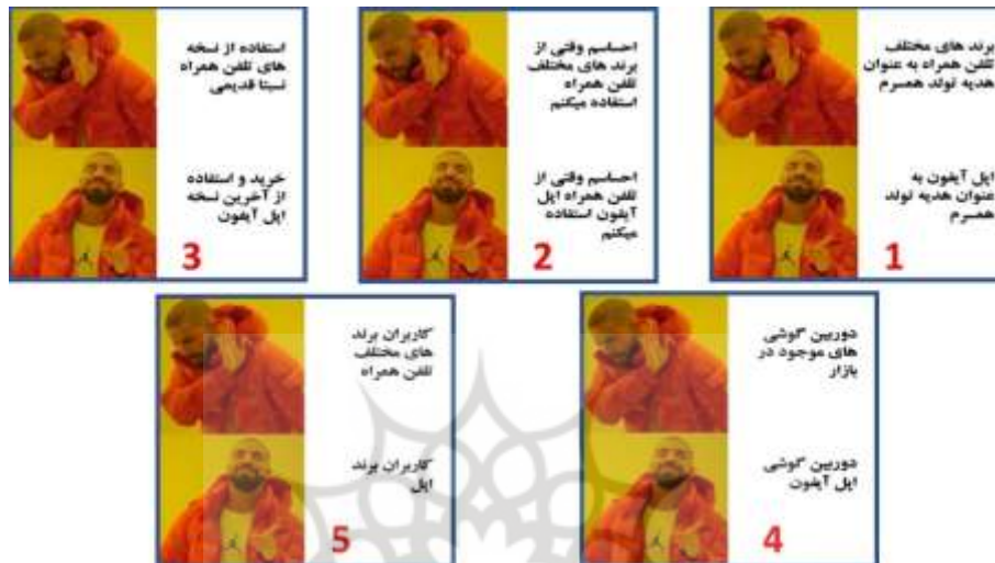
شکل 2. نمونه‌ای از یاده‌های طراحی شده در این تحقیق

بر اساس مدل پیاز پژوهش ساندرز 1 و همکاران (2023)، این تحقیق از نظر فلسفی پژوهشی اثبات‌گرا، رویکرد استقرائی و از استراتژی پژوهش آزمایشی مقطعی استفاده می‌کند. همانطور که گفته شد، در این پژوهش از روش تحقیق آزمایشی، طرح فاکتوریل دو (دارای نمادیت و فاقد نمادیت) در دو (ارزش‌های مصرف کارکردی، معرفتی، اجتماعی، عاطفی، و مشروط) استفاده شده است. برای اجرای این آزمایش، ده یاده (شکل 2) طراحی شده و برای اطمینان از اعتبار و روایی یاده‌های طراحی شده، این یاده‌ها پیش‌آزمون شد. نتیجه این آزمون نشان می‌دهد که یاده‌های طراحی شده از نظر پاسخ‌دهندگان تفاوت معناداری داشته است ( t=7.57, p \text{ value}=0.0 ).