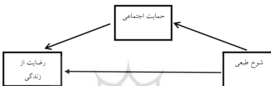
شکل ۱. مدل نظری - مفهومی تحقیق

حرمت‌خود انجام دادند. نتایج تحلیل مسیر حاکی از آن است که حمایت اجتماعی با سه متغیر خودکارآمدی، حرمت‌خود و رضایت از زندگی رابطه مثبت و معناداری دارد. افزون بر آن، رابطه حرمت‌خود با رضایت از زندگی و رابطه خودکارآمدی با حرمت‌خود مثبت و معنادار است. فروهر و همکاران (۱۳۹۵) تحقیق تحت عنوان رابطه شوخ‌طبعی و پرخاشگری با رضایت از زندگی دانش-آموزان دوره متوسطه انجام دادند. نتایج به دست آمده بیانگر این بود که بین متغیرهای شوخ‌طبعی و رضایت از زندگی رابطه معنادار وجود دارد و بین شوخ‌طبعی و پرخاشگری و رضایت از زندگی رابطه معناداری وجود ندارد.