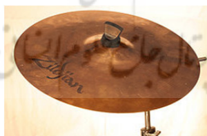
تصویر ۱: دستگاه موسیقی عاشورایی، سنج، میناب، عاشورا ۱۳۹۸.

سنج: نوعی ساز ضربی زنگ‌وار از جنس برنج به قطر ۳۰ تا ۴۰ سانتیمتر است. دسته کوتاه ۱۰ سانتیمتری دارد و جهت ایمن سازی آن و اثبات ناخودآگاه با دست دسته‌ها را با تکه‌های پارچه عایق می‌کنند (اطرائی، درویشی؛ ۱۳۹۶: ۱۳۴).