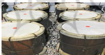
تصویر ۵: دستگاه موسیقی عاشورایی، دمام زیر غمبر، مسقط، عاشورا ۱۳۹۸.

دَمَام زیر غَمْبَر: همچنین به دلیل ساده بودن نواختن آنها نسبت به بقیه‌ی دمام‌ها، به عنوان دمام ساده و معمولی هم شناخته می‌شوند. کار آنها نیز مانند دمام غمبر در طول قطعه، مشخص و ثابت است (حسنی پور؛ ۱۳۹۸: ۱۸۲).