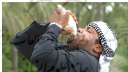
تصویر ۷: دستگاه موسیقی عاشورایی، صدف (گُر)، میناب، عاشورا ۱۳۹۸.

صَدَف (گُر): سازی کاربردی با صدای بم به عنوان شروع کننده موسیقی در مراسم مذهبی روز عاشورا به کار برده می شود. در برخی مراسم سنج و دمام که به صورت وارداتی از بوشهر به میناب آمده است، بوق جای این ساز را گرفته است. لذا با تاکید بر اجرای اصیل و بومی سازهای منطقه میناب در می یابیم که صدف یا گُر از جمله سازهای سنتی بوده که در جامعه مدرن امروزی مورد استفاده قرار گرفته است. با مراجعه به مراکز فروش دستگاه‌های موسیقی بوق‌های الکترونیکی وجود دارد که بدون نیاز به فشار به حنجره با بلندترین صدا نوازندگی می شود. اما این ساز اصیل در بطن خود دنیایی را به خاطر می آورد که در جامعه مدرن و الکترونیکی امروز یافت نمی شود. صدف را ماهیگران از دریا گرفته و داخل آن را خالی نموده و پس از نظافت به صورت یک ساز بادی از آن استفاده می نمایند. صدف را به صورت انفرادی اجرا نموده و با دمیدن به داخل ساز آن را به صدا در می آورند.