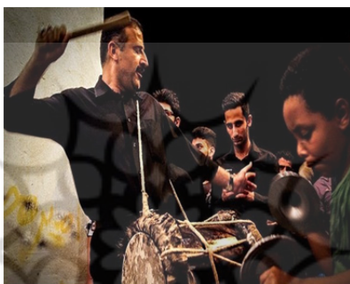
تصویر ۳: دستگاه موسیقی عاشورایی، دمام اشکون، میناب، عاشورا ۱۳۹۸.

دَمَامِ اشکون: در ادامه بر اساس مشاهدات و حضور در برگزاری چنین مراسمی در روز عاشورا لازم دانسته می‌شود که در خصوص دمام اشکون نیز اطلاعاتی ارائه شود، دمام اشکون در سر دسته قرار دارد. صدای آن زیرتر و شکل آن جمع و جورتر است. نوازنده این ساز پس از نواخته شدن بوق، با اجرای فیگورهای نوازنده غم‌بر، معمولاً ۲ الی ۴ میزان تکنوازی می‌کند و بدینوسیله ریتم و سرعت آن را به سایر نوازنده‌ها منتقل می‌نماید. نوازنده اشکون، در پس نواخته شدن سایر سازها، در چارچوب ریتم آزادانه و به صورت بداهه، با اجرای فیگورهای متنوع، به شکستن ریتم اصلی می‌پردازد و بدین‌وسیله به نام خود یعنی اشکون (به معنی شکننده ضرب) معنی می‌دهد.