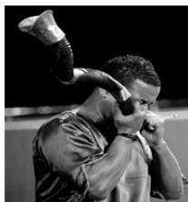
تصویر ۶: دستگاه موسیقی عاشورایی، بوق، مسقط، عاشورا ۱۳۹۸.

صَدَف (گُر): سازی کاربردی با صدای بم به عنوان شروع کننده موسیقی در مراسم مذهبی روز عاشورا به کار برده می شود. در برخی مراسم سنج و دمام که به صورت وارداتی از بوشهر به میناب آمده است، بوق جای این ساز را گرفته است. لذا با تاکید بر اجرای اصیل و بومی سازهای منطقه میناب در می یابیم که صدف یا گُر از جمله سازهای سنتی بوده که در جامعه مدرن امروزی مورد استفاده قرار گرفته است. با مراجعه به مراکز فروش دستگاه‌های موسیقی بوق‌های الکترونیکی وجود دارد که بدون نیاز به فشار به حنجره با بلندترین صدا نوازندگی می شود. اما این ساز اصیل در بطن خود دنیایی را به خاطر می آورد که در جامعه مدرن و الکترونیکی امروز یافت نمی شود. صدف را ماهیگران از دریا گرفته و داخل آن را خالی نموده و پس از نظافت به صورت یک ساز بادی از آن استفاده می نمایند. صدف را به صورت انفرادی اجرا نموده و با دمیدن به داخل ساز آن را به صدا در می آورند.