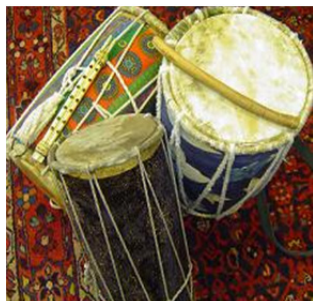
تصویر ۱۲: دستگاه موسیقی عاشورایی، پیپه، میناب، عاشورا ۱۳۹۸.