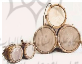
تصویر ۹: دستگاه موسیقی عاشورایی، کِسر، میناب، عاشورا ۱۳۹۸.

کِسر: نحوه اجرا و ضرباهنگ کسر و دهل با هم تفاوت دارد. کار کسر ایجاد صداهایی با ریتم و شکستن ریتم دهل و پیپه است که با ریتم و نظم خاصی وارد می‌شوند. نخست قلم جفتی با ریتم و سرعت مشخص، سپس دهل و پس از آن پیپه و کسر وارد می‌شوند. نوازنده این ساز معمولاً شخصی با تجربه است چرا که در ریتم موسیقی جنوب نواختن کسر بسیار حائز اهمیت بوده و ترنم خاصی را به موسیقی می‌بخشد (غ.ذاکری، مصاحبه شخصی، ۲۶ دی، ۱۳۹۸).