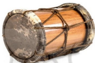
تصویر ۲: دستگاه موسیقی عاشورایی، دمام، میناب، عاشورا ۱۳۹۸.

دمام: نگارنده این تحقیق به دلیل حضور در منطقه و همکاری با گروه‌های هنری ویژه آئین و مناسک مذهبی، بر اساس مشاهدات انجام شده چنین اذعان می‌دارد که سازندگان دمام برای ساختن این ساز، دو عدد پوست دباغی شده‌ی بز را به کمک دو جفت حلقه‌ی دایره‌ای شکل، بر روی دو طرف بدنه‌ی ساز، نگه می‌دارند. هر کدام از این حلقه‌ها را چمبره یا چمبرک می‌نامند. چمبره در گذشته از چوب درخت خیزان ساخته می‌شد.