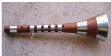
تصویر ۱۰: دستگاه موسیقی عاشورایی، سُرنا، میناب، عاشورا ۱۳۹۸.

آواهای عاشورایی: بررسی تطبیقی موسیقی ... (بابک دهقانی و سیما صابرصلغی) ۴۹