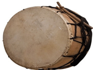
تصویر ۸: دستگاه موسیقی عاشورایی، گپ دُهل (مارساز)، میناب، عاشورا ۱۳۹۸.