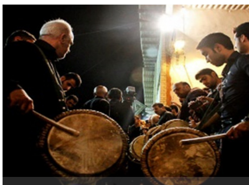
تصویر ۴: دستگاه موسیقی عاشورایی، دمام غمبر، مسقط، عاشورا ۱۳۹۸.

به وجد می‌آورد. بعضی واژه غمبر را برگرفته از شور و احساسی می‌دانند که بر اثر نواختن به نوازنده دست می‌دهد (شریفیان؛ ۱۳۸۴: ۱۸۱).