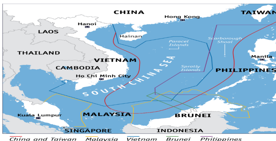
شکل (۱). موقعیت دریای چین جنوبی منبع: (هاسکین، ۲۰۱۹: ۴)