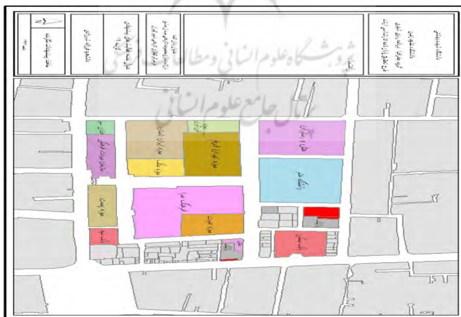
شکل ۵. نظام کارکردی پیشنهادی (گزینه اول)