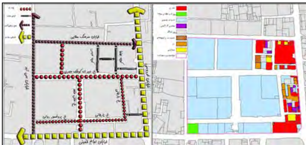
شکل ۳. سلسله مراتب شبکه معابر موجود و کاربری اراضی در محدوده

ریزدانه‌تر از آن و از لحاظ عملکردی از مجموعه میدان جدا افتاده است. شکل ۳، سلسله مراتب شبکه معابر موجود و کاربری اراضی را نشان می‌دهد.