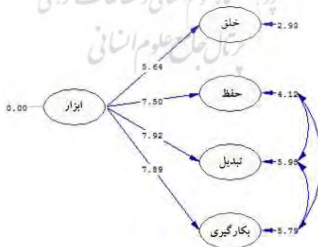
نمودار (۳): آماره‌های آزمون برای ضرایب مدل

جدول (۶) به بررسی ضریب تأثیر بین متغیرهای خلق دانش در ستاد مبارزه با مواد مخدر و ابزارهای