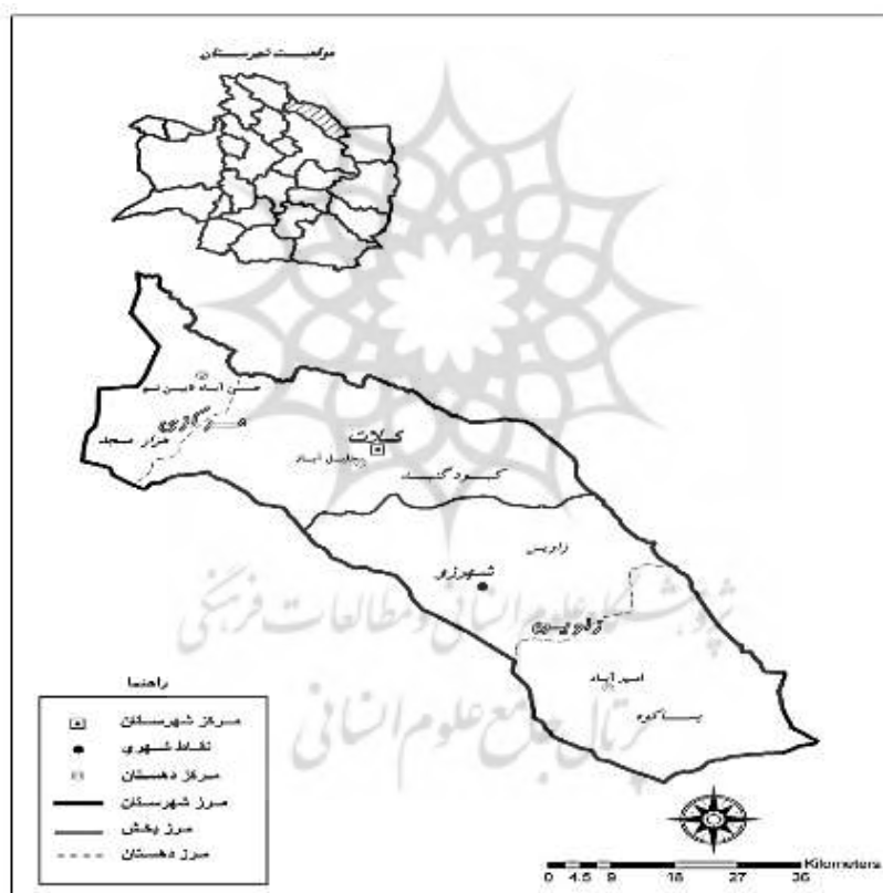
شکل ۱. نقشه تقسیمات سیاسی شهرستان کلات

براساس سرشماری سال ۱۳۹۵، جمعیت روستاهای نمونه ۵۲۸۳ نفر بود که در مقایسه با سال ۱۳۹۰ (جمعیت ۵۸۷۷ نفر) نرخ رشد منفی (۲/۱۰۹-) داشت.