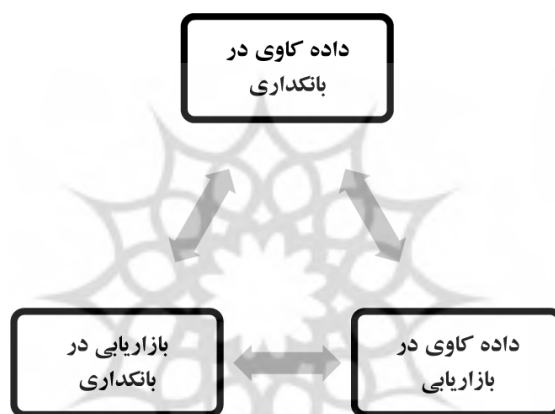
شکل ۱. رویکردهای سه گانه ارتباط داده کاوی، بانکداری و بازاریابی

همکاران، ۲۰۰۹). به کارگیری فناوری اطلاعات در بانکداری الکترونیکی منجر به ایجاد حجم وسیعی از داده‌های مشتریان شده است. سه رویکرد قابل طرح است که در شکل ۱ مشاهده می‌شود. ۱. داده کاوی در بانکداری. ۲. داده کاوی در بازاریابی. ۳. بازاریابی در بانکداری. در رویکرد اول می‌توان از داده کاوی به عنوان یک فناوری اطلاعات در بانکداری الکترونیکی برای کشف دانش در حجم وسیعی از داده‌های مشتریان استفاده نمود.